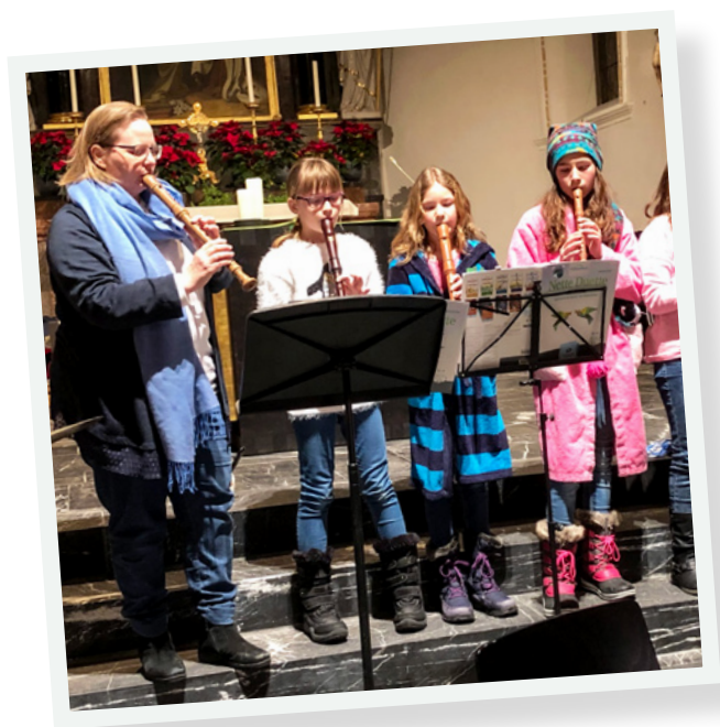
Das Blockflöten-Ensemble an der Winter-Soirée 2019

Im Anschluss an das Konzert können Sie bei winterlichen Verhältnissen auf dem Platz vor dem Gemeindehaus einen warmen Punsch geniessen und sich zu einem Schwatz mit Musiklehrpersonen oder Konzertbesuchern einlassen.