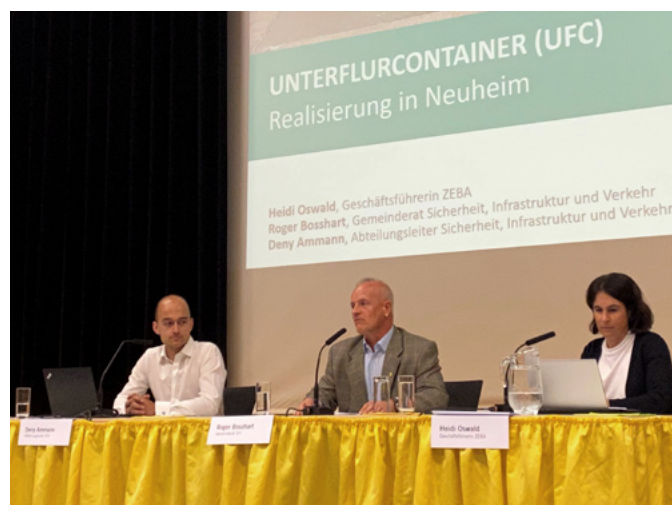
Die Gemeindevertreter und die Geschäftsführerin der ZEBA informierten über die geplante Umsetzung der UFC-Anlagen.

Die Stimmung der anwesenden Personen zum Thema «Unterflurcontainer (UFC)» war durchwegs positiv. Ein Votum forderte, dass gleich auch Reserveelemente für die Zukunft eingebaut werden sollen. Weiter wurde die Überprüfung einer Kostenbeteiligung an bereits privat umgesetzten UFC-Anlagen gewünscht. Eine Lösung für das Grüngut sowie das Gewerbe und die Landwirtschaft, welche seitens ZEBA noch ausstehend, jedoch in der Entwicklung ist, wurde abschliessend diskutiert. Die Fragen konnten von den Fachpersonen beantwortet werden. Die Stimmbewölkerung entscheidet am 12. März 2023 an der Urne über den Kredit zur Umsetzung von weiteren Unterflurcontainer-Anlagen.