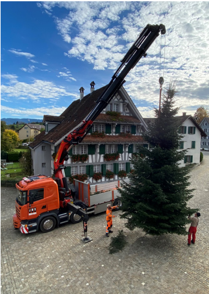
Der Neuheimer Weihnachtsbaum wird mit fachmännischer Arbeit und zur Freude der Schaulustigen auf dem Dorfplatz aufgerichtet.

Auch dieses Jahr durfte die Gemeinde von einem privaten Gelände den Neuheimer Weihnachtsbaum auswählen. Der Baum wird der Gemeinde jeweils geschenkt. Für das Fällen, Transportieren und Aufrichten kommt die Gemeinde auf. Dabei ist das Werkhofteam tatkräftig an der Arbeit. Die forstlichen Arbeiten können dank ausgebildeten Spezialisten selbst erledigt werden. So war es am 8. November wieder so weit und unser Weihnachtsbaum wurde fachmännisch auf dem Dorfplatz aufgerichtet und geschmückt. Da die Gemeinde auf weitere Weihnachtsbeleuchtungen bewusst verzichtet, wird der Tannenbaum auf dem Dorfplatz zeitbegrenzt beleuchtet. Dem Werkhofteam, dem Baumsponsor und unserem Logistikpartner danken wir herzlich für den Einsatz. Wir wünschen viel Freude und eine besinnliche Adventszeit!