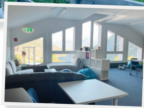
Unterricht bei bester Aussicht – Val d'Hérens