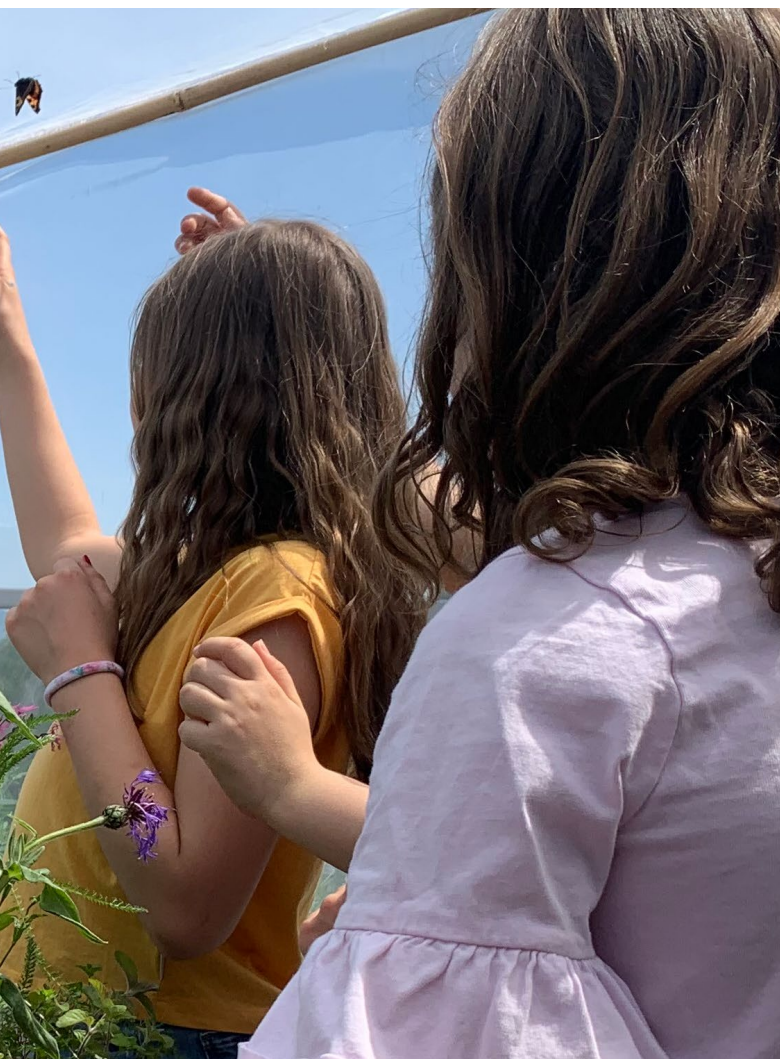
Schülerinnen beobachten die geschlüpften Falter