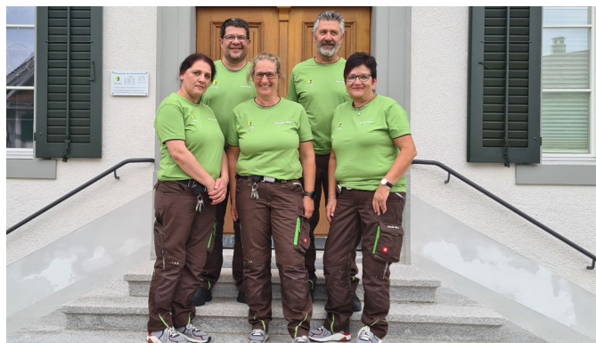
Das Hausdienst / Support Team im neuen Look

Der Hausdienst / Support der Gemeindeverwaltung wurde mit neuer Arbeitskleidung ausgestattet. Der bisherige Lieferant zog sich aus dem Segment zurück, weshalb eine Umrüstung notwendig wurde. Für die Aussenwirkung und Erkennbarkeit wurde das komplette Team einheitlich ausgerüstet und mit dem Namen und dem Gemeindelogo beschriftet. Die neue Arbeitskleidung ist seit Anfang Juni im Einsatz.