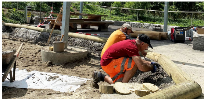
Der Werkdienst optimiert derzeit den Spielplatz Chilematt

Der Werkhof wird bis zu den Sommerferien Optimierungen beim Spielplatz Chilematt vornehmen. Vorgesehen sind Anpassungen des Kies- und Sandbereiches, der Spielgeräte und die Installation eines zusätzlichen Sonnensegels über dem Sandbereich. Die Bauarbeiten können zu Teilsperren der Spielbereiche führen. Wir danken für die Geduld und das Verständnis.