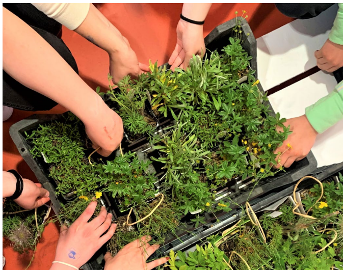
Fleissige Hände pflanzen Wildstauden an

Das Landschaftsentwicklungskonzept (LEK) Neuheim hat sich zum Ziel gesetzt, wieder vermehrt einheimische Pflanzen im Dorf zu pflanzen. Daher haben die Schülerinnen und Schüler der Schule Neuheim einheimische Wildstauden verteilt. Diese bieten einer grossen Anzahl einheimischer Tierarten wie Schmetterlingen, Bienen und vielen weiteren Insekten ein Zuhause oder eine Nahrungsquelle.