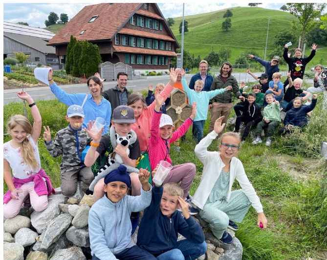
Feierlich konnten die Bienenhotels eröffnet werden

Neuheim ist um fünf Hotels reicher. Am 31. Mai 2022 haben die Erbauerinnen und Erbauer ihre Wildbienenhotels am Dorfeingang eröffnet.